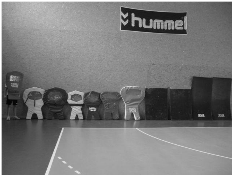
Figure 2 : Du tapis de protection au stop-shoot