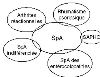
Fig. 35.1. Le groupe des spondylarthropathies (SpA).