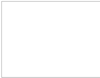
Fig. 30.2. Algodystrophie du genou droit. Scintigraphie osseuse (temps tardif). Hyperfixation des deux versants de l'articulation et de la rotule.