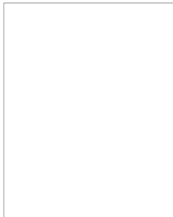
Fig. 30.1. Algodystrophie du pied. L'aspect caractéristique est une déminéralisation mouchetée de l'avant-pied avec respect des interlignes articulaires.