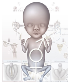
Figure 34 : Les anomalies du développement des gonades

Les anomalies du développement des gonades peuvent revêtir plusieurs aspects. L'« hermaphrodisme vrai », très rare, est le tableau le plus complet résultant de la coexistence de tissu ovarien et testiculaire (ovo-testis) ou d'une gonade de chaque sexe. L'appareil génital est un ensemble structures dérivées des canaux de Wolff et de Müller et les organes génitaux externes présentent un aspect indéterminé.