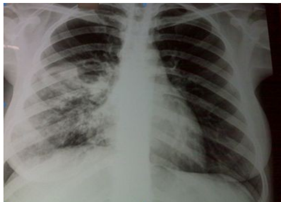
Figure 3 : Radiographie du thorax de face d'une caverne tuberculeuse

Réf : http://fr.wikinoticia.com/style%20de%20vie/beaut%C3%A9/111585-depistage-de-la-tuberculose